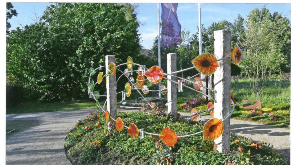
Steinmetz Herbert Baldauf gestaltete die Urnengemeinschaftsanlage „Blätter im Wind“.

grabanlage in Alzenau. Die von Steinmetz Herbert Baldauf (Immenstadt) gestaltete Urnenanlage „Blätter im Wind“ erregt schnell die Aufmerksamkeit der Gartenschau-besucher. Das filigrane Gebilde aus Metall, Glas und Stein windet sich um ein ruhig bepflanztes Oval, in dem 30 bis 40 Urnen Platz finden. Die Namen der Verstorbenen sind in gläserne Blätter eingraviert. Eine würdige und kreative Alternative zur gängigen Urnenmauer, denn das Grabmal strahlt Lebendigkeit und Offenheit aus.