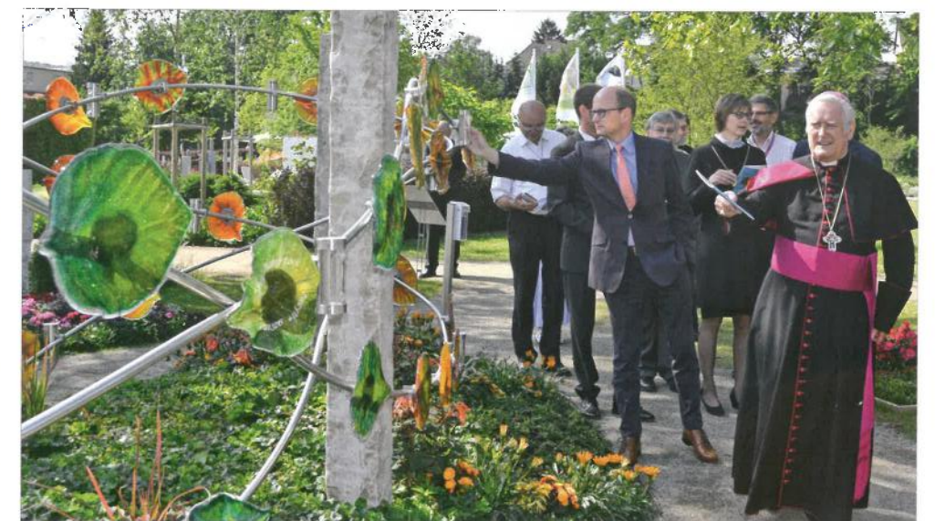
Besuch von Friedhelm Hofmann, Bischof der Diözese Würzburg und Gisela Bornowski, Regionalbischöfin im Kirchenkreis Ansbach-Würzburg. Die Urnenanlage weckte besonderes Interesse.

Gemeinschaftsgrabanlagen sind nicht nur ein wichtiges Thema heutiger Friedhofskultur, sondern auch das zentrale Element der Muster-